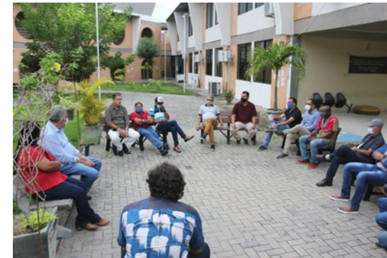
Reunião no pátio da sede do Campus, em Delmiro Gouveia

O Campus do Sertão já iniciou a discussão sobre a criação de pós-graduação stricto sensu . Além disso, três novos cursos de pós lato sensu