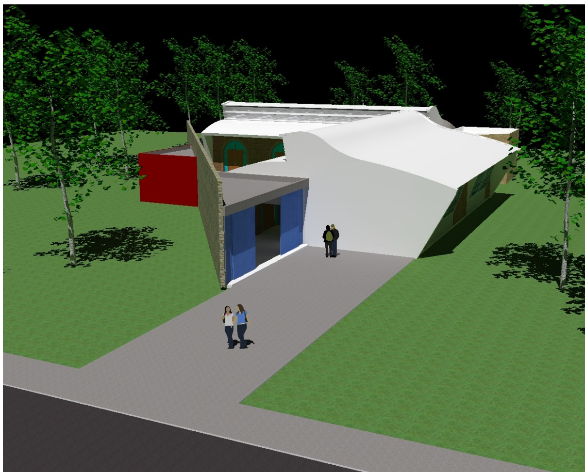
Campus do Sertão/UFAL Sede Delmiro Gouveia