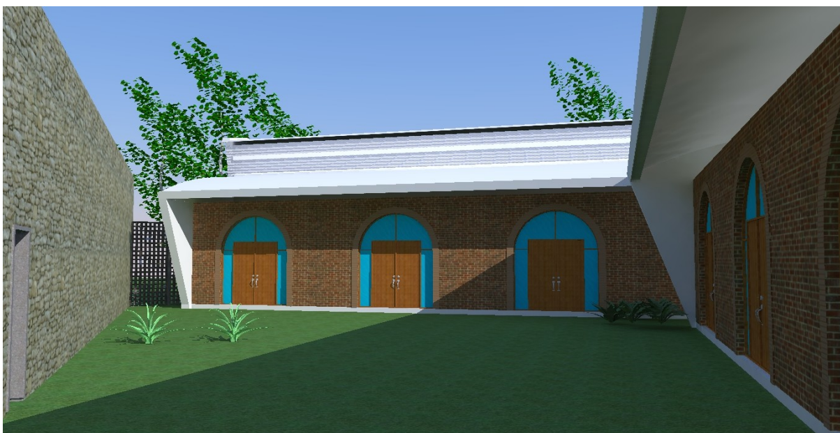
Imagem do pátio interno da edificação.

Está sendo apresentada, neste portfólio, a construção de dois prédios idênticos, seguindo o modelo arquitetônico do Campus do Sertão, conforme projeto em anexo.